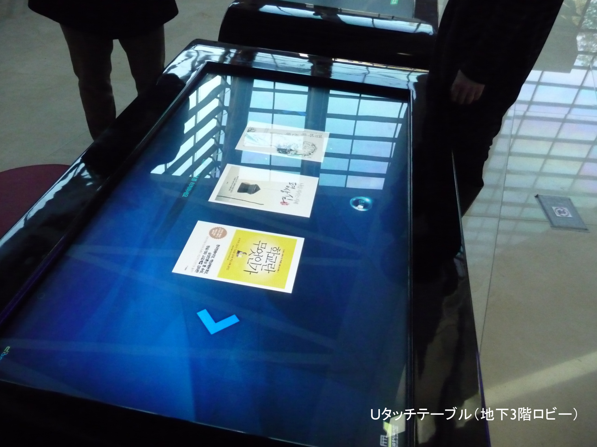
Uタッチテーブル(地下3階ロビー)