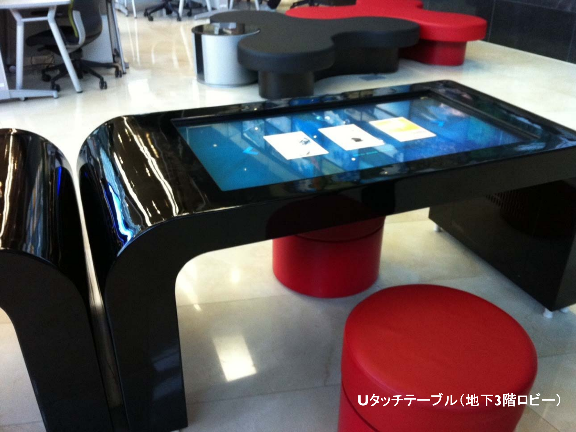
Uタッチテーブル(地下3階ロビー)