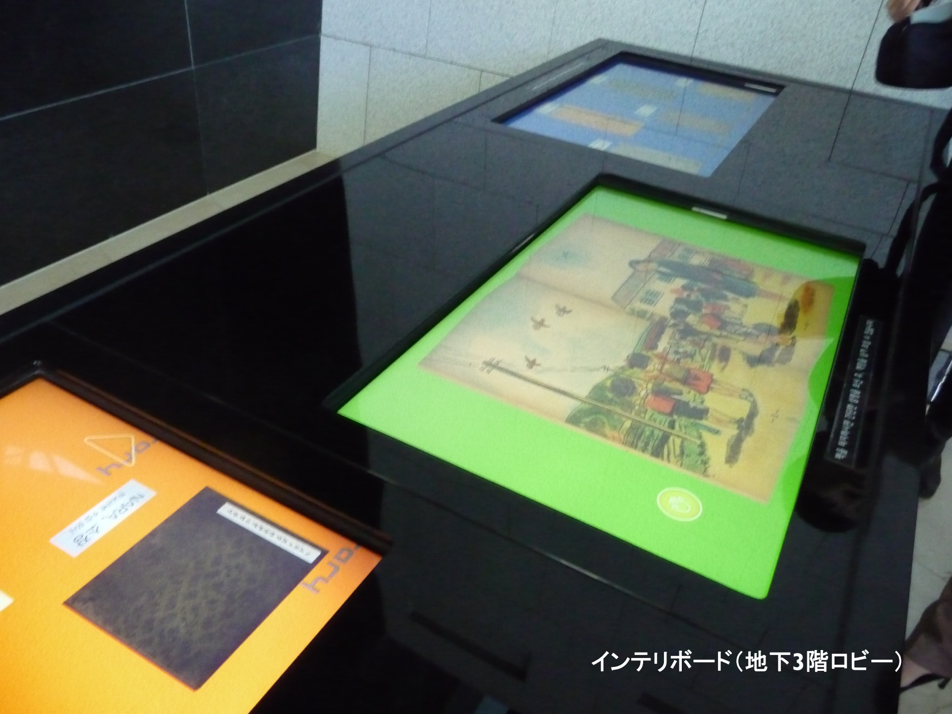
インテリボード(地下3階ロビー)