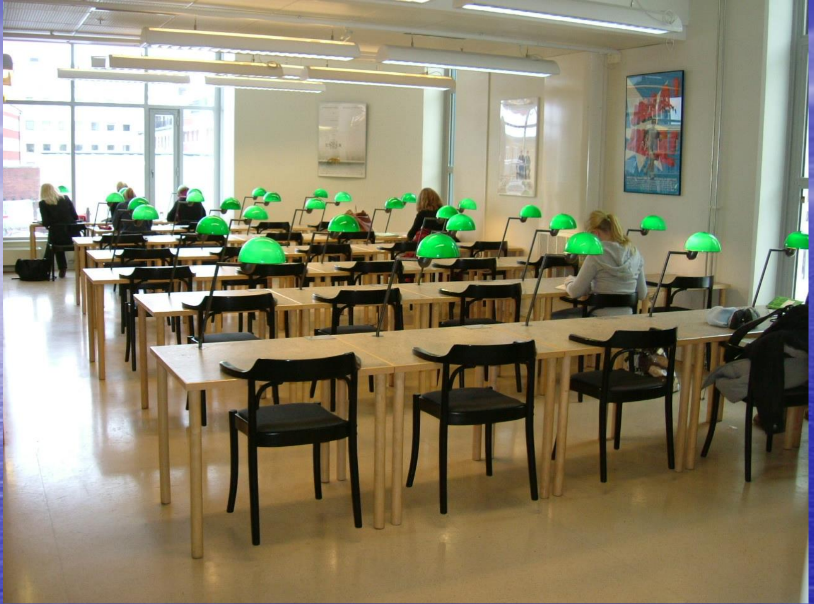
ダグ・ハマーショルド記念図書館