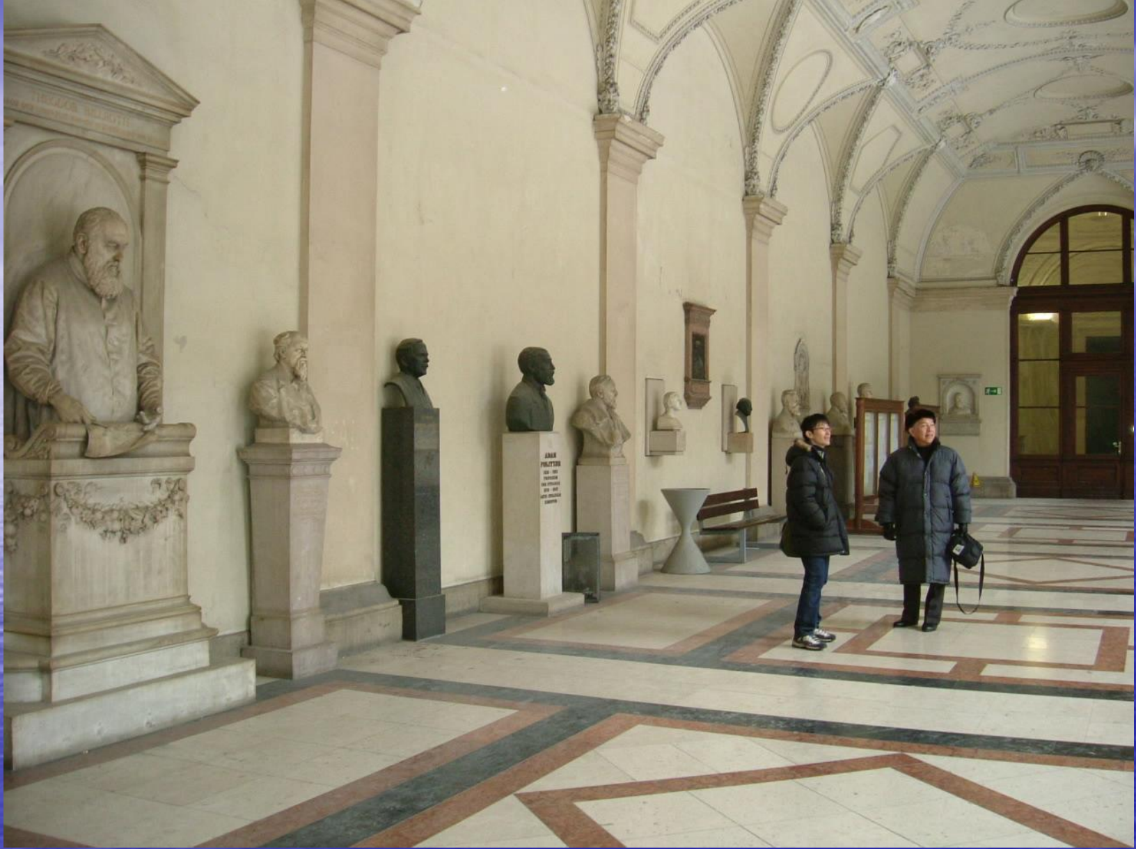
ウィーン大学の回廊