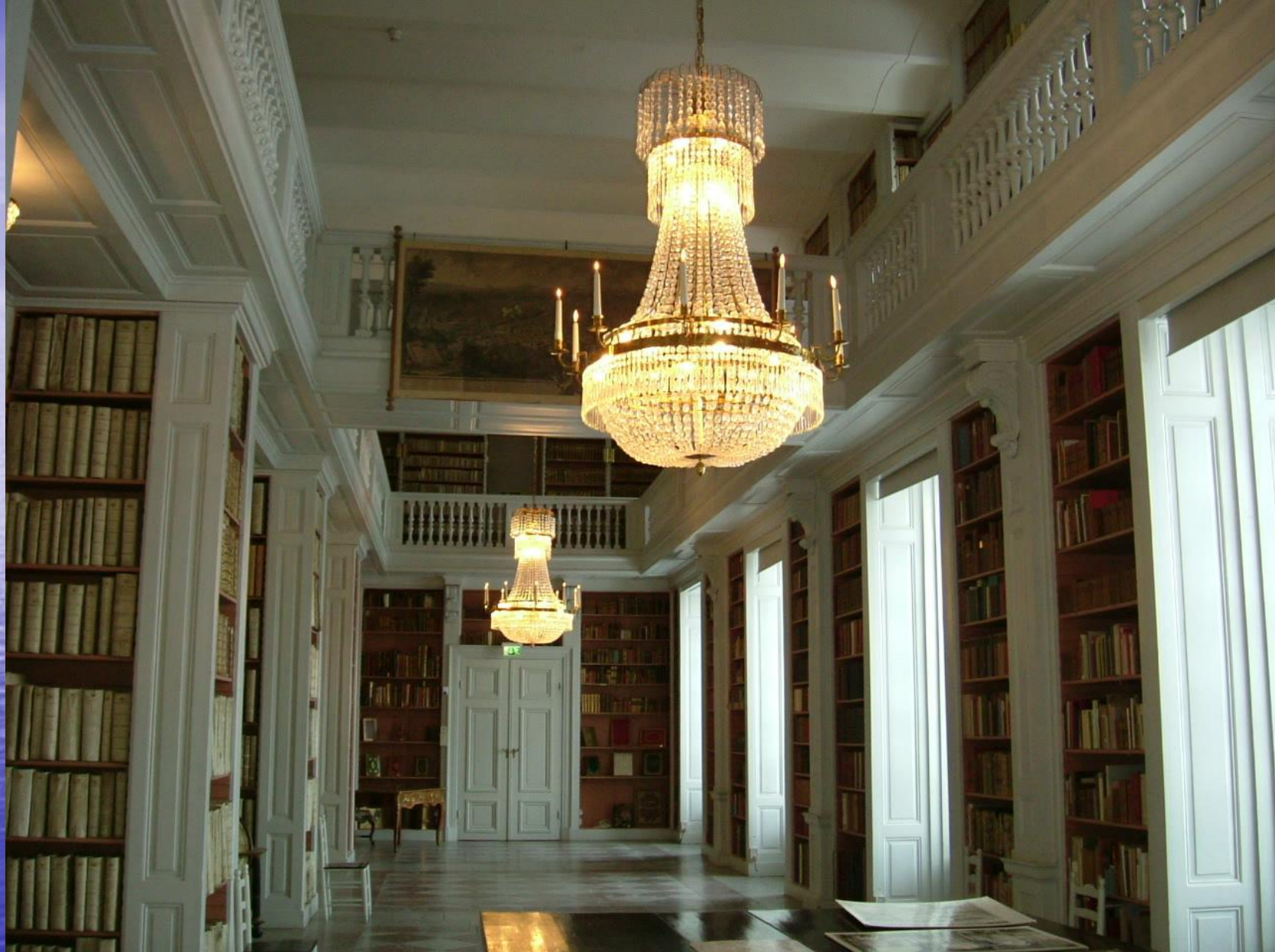
ウプサラ大学中央図書館