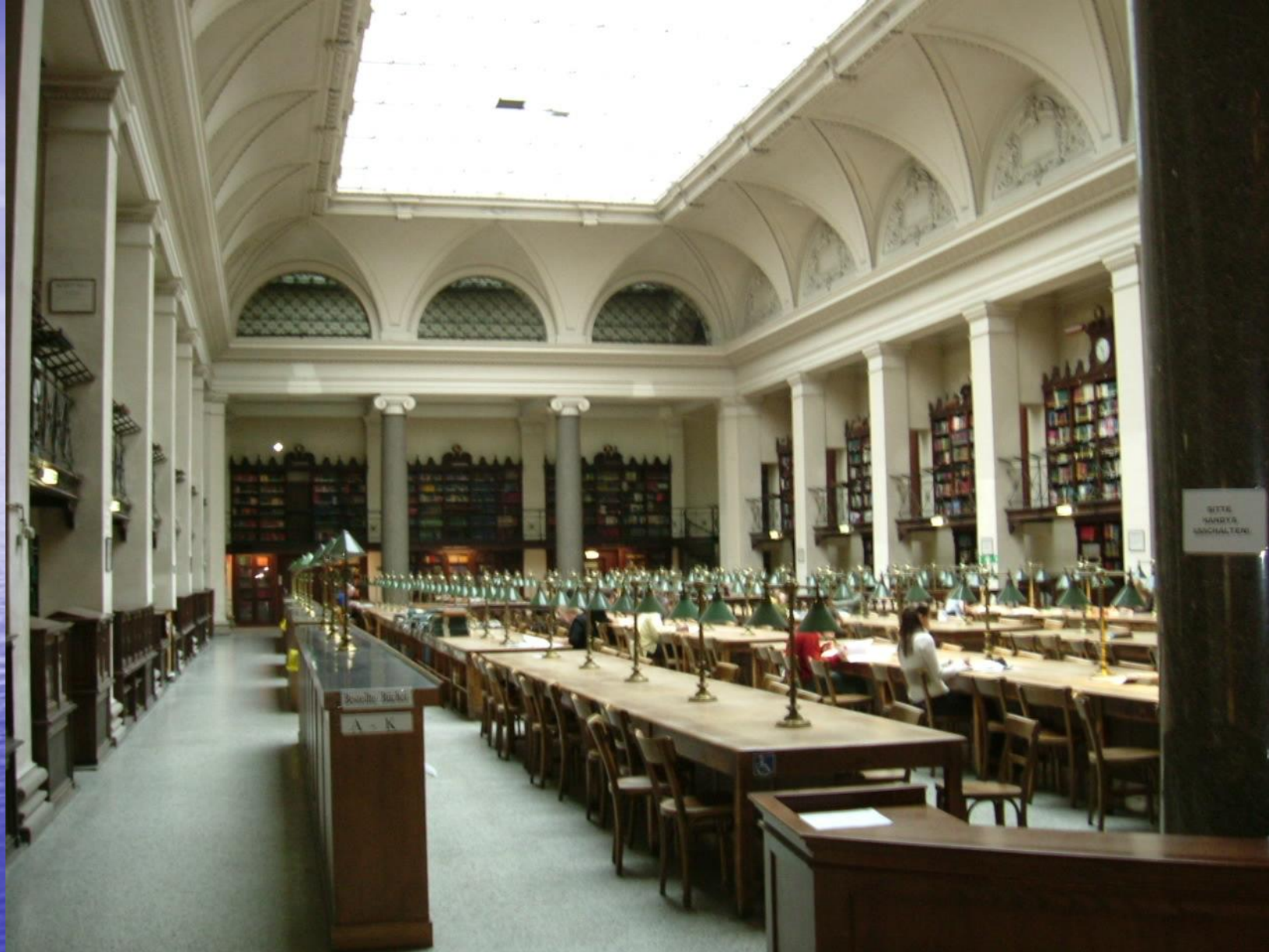
ウィーン大学図書館閲覧室