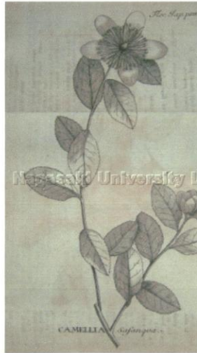
▲サザンカ Cammellia sasanqu.