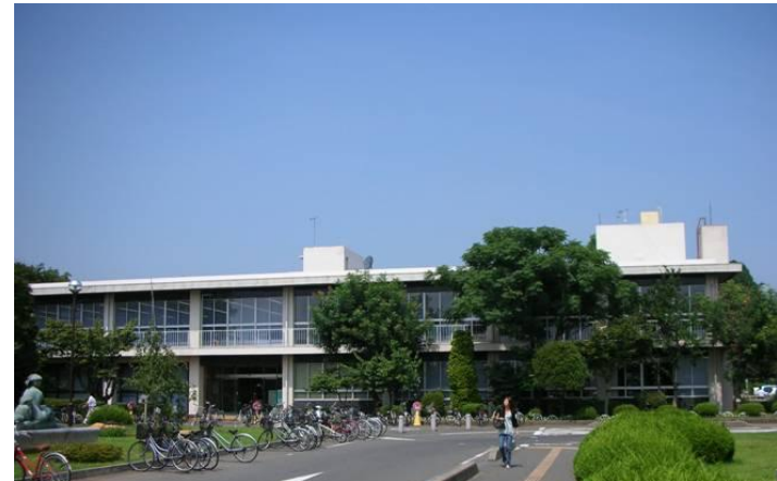
図書館本館・外観