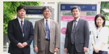
図書館連携・協力室