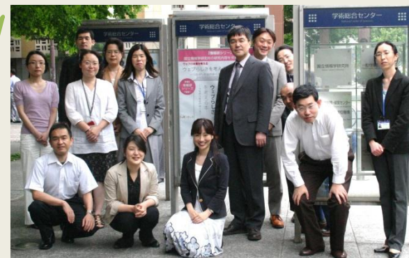
学術コンテンツ課